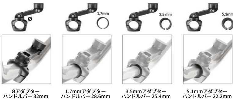
0アダプター ハンドルバー 32mm